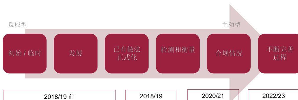
图 3：产权组织防欺诈路线图的时间线

1.31 成员国和捐助方始终期望其所管理和资助的国际组织具有高道德标准。2019 年，欺诈风险和联合国系统的相关回应依然是联合国外聘审计团的联合国系统审计员之间所讨论的主要内容。如我们此前所报告，产权组织坚决致力于欺诈防范与监测。在产权组织自 2012 年以来的工作基础上，总干事于 2018 年 3 月批准了欺诈风险路线图，有效期持续至 2022-2023 两年期。该路线图下的行动包括产权组织所要实施的预防性、监测性和响应措施。